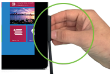
Correcto: desenchufar suavemente