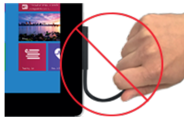
Incorrecto: tirar del cable para desenchufar