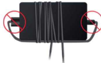
Incorrecto: cable envuelto demasiado apretado.